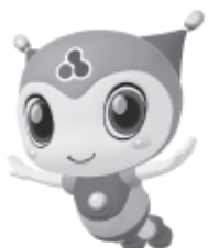
マスコットキャラクター「ココロくん」

LPガスと太陽光発電など、複数のエネルギーを有効に組み合わせ、エコと快適を両立したライフスタイルを提案します。