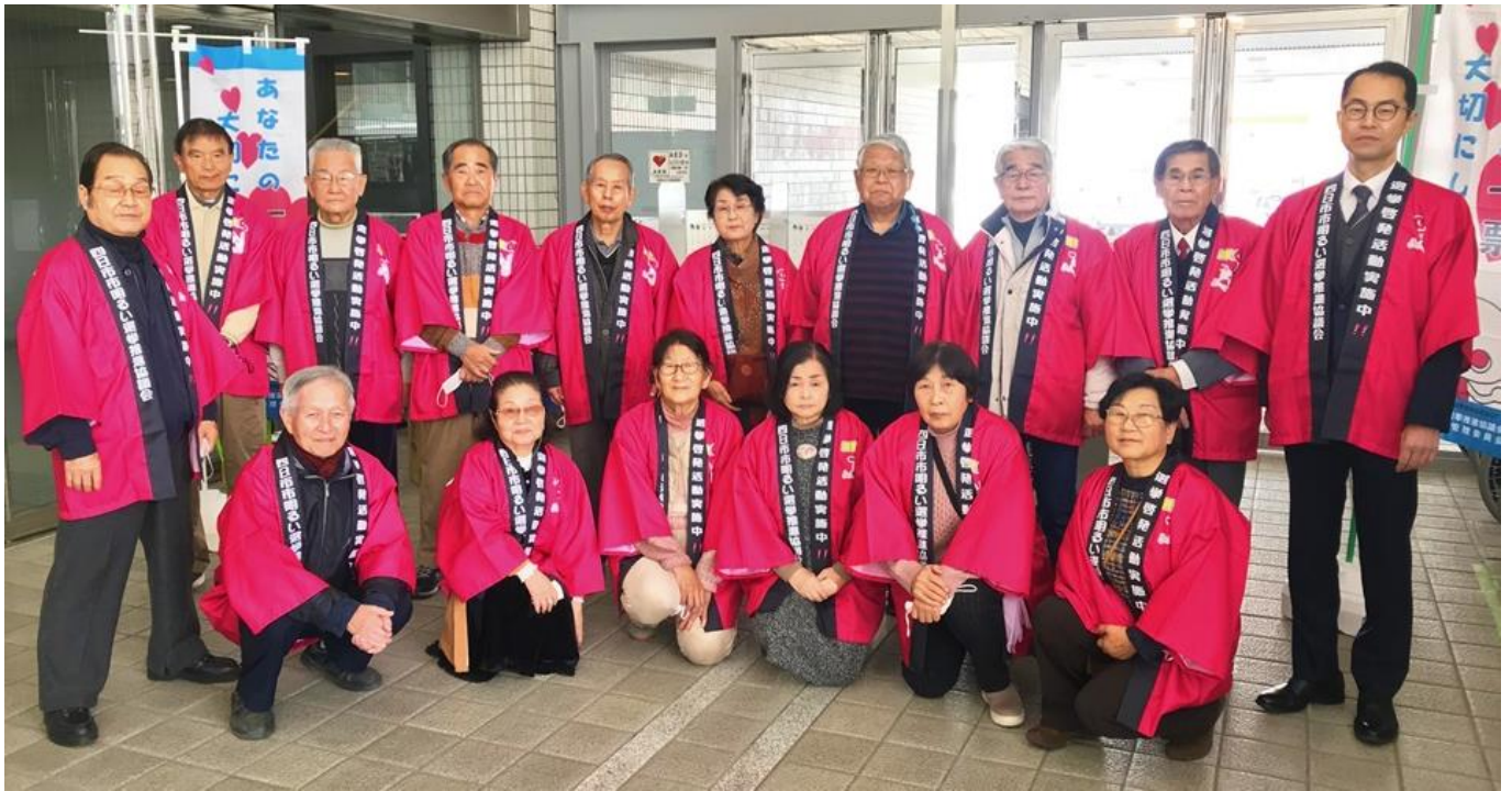
四日市市文化会館で開かれた新成人への選挙啓発に参加した地区幹事のみなさん