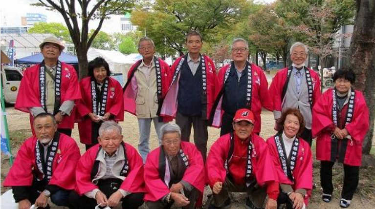
選挙啓発に参加したモデル地区の委員のみなさん