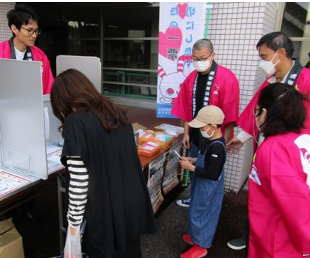
四日市大学祭での選挙啓発の様子