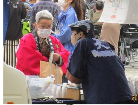
啓発物資を配布する委員